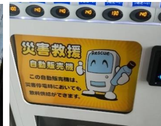
災害ベンダーマーク例