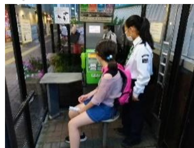
車いすでも使える公衆電話